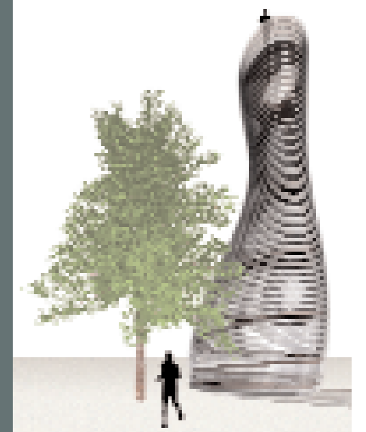
Winnend prijsvraagontwerp voor een nieuwe uitkijktoren voor het uitbreidingsgebied Groot Vijversburg van Next Architects, 2003.

op het grensvlak van beeldende kunst, architectuur, wetenschap en techniek. Voor een deelverklaring van het begrip passage, dat duidt op het overschrijden van een grens tussen uiteenlopende disciplines, is in de genoemde vroegere tentoonstellingen de kiem gelegd. Deze 'meeting of minds' komt met de tentoonstelling Passages thans nog nadrukkelijker in beeld. Tenslotte geeft de tentoonstelling zelf aan het begrip passage een verdere inhoudelijke verdieping door een essay van de auteur Dirk van Weelden (tevens exposant) waarbij het antropologische begrip rite de passage wordt vertaald naar de tentoonstelling en het landgoed. In het tentoonstellingsconcept is een verbinding gelegd met de artes liberales (de zeven vrije kunsten) waarbij wordt teruggegrepen naar de tijd dat kunst, wetenschap en techniek nog een eenheid vormden. De tentoonstelling beoogt de uit elkaar gegroeide disciplines weer te herenigen, met een bijzonder oog voor het creatieve proces: Kunst en wetenschap worden beide gekenmerkt door onderzoek en experiment. Deze synergetische waarde is een belangrijk onderwerp dat tijdens het symposium aan de orde komt.